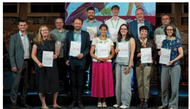
Auszeichnungsveranstaltung simul+Kreativ 2024 - © Sächsisches Landeskuratorium Ländlicher Raum e. V.

Auch Preisträger aus der Region Annaberger Land waren zur Auszeichnungsveranstaltung vor Ort.